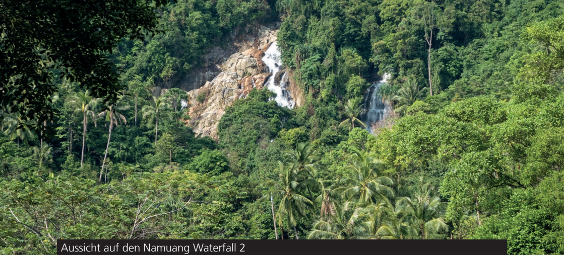
Aussicht auf den Namuang Waterfall 2

Nun geht es wieder zurück nach links auf die Hauptstraße. Biege die nächste Straße rechts ab, um weiter nach Süden zu fahren. An der Kreuzung mit dem 7-Eleven biege nach rechts ab. Fahre die Straße etwa 5 Minuten entlang, bis auf der linken Seite ein kleines blaues Schild mit dem Namen "Laem Sor" erscheint. Biege links ab. Am Ende dieser Straße findest du die Laem Sor Pagode (6) vor. Siehe auch Seite 71.