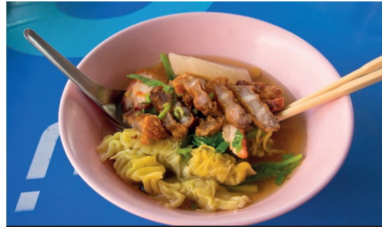
Bami Kiau Moo Grob