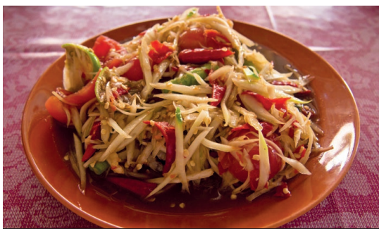
Som Tam Poo Plara