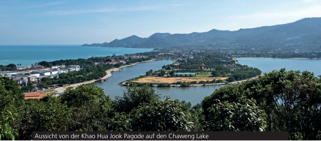
Aussicht von der Khao Hua Jook Pagode auf den Chaweng Lake