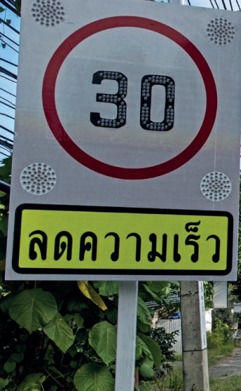
Auf der großen Ringstraße am Elephant Rock vor Lamai

sind viele Motorroller unterwegs – teilweise mehr als Autos. Regeln werden oft nicht so richtig beachtet. Sei vorsichtig, vorausschauend und fahre langsam , wenn du selber Motorroller oder Auto fährst.