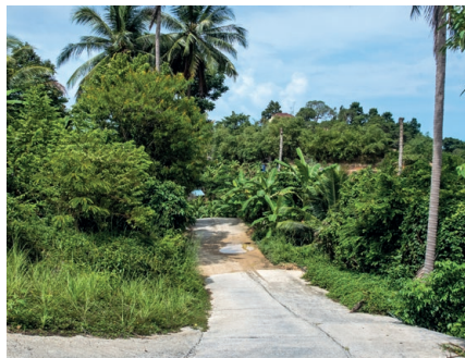
Fahre vorsichtig auf schlechten Straßen

Auf Koh Samui herrscht relativ viel Verkehr, besonders auf der Ringstraße , die um die Insel führt sowie auf der Chaweng Beach Road . Es gibt nicht nur viele Roller, sondern auch Autos und Lastwagen, die oft rasen und an unmöglichen Stellen überholen. Fahre deshalb extra vorausschauend und vorsichtig.