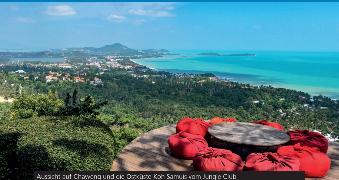
Aussicht auf Chaweng und die Ostküste Koh Samuis vom Jungle Club

In diesem Buch zeigen wir dir daher alles, was du für die Planung einer Reise nach Koh Samui wissen musst. Es geht hierbei darum, die Insel schon vor deinem Besuch kennenzulernen und einen guten Einblick vorab zu bekommen.