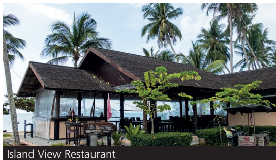
Island View Restaurant

Zum letzten Ziel fährst du durch das Elephant Gate hindurch und am Ende der Straße nach rechts. Nach wenigen Minuten kommt auf der linken Seite ein Sandweg, der die Einfahrt zum Island View Restaurant (9) am Taling Ngam Beach darstellt. Hier kannst du nun zum Tagesabschluss etwas essen, trinken und den schönen Sonnenuntergang vor Koh Samui genießen.