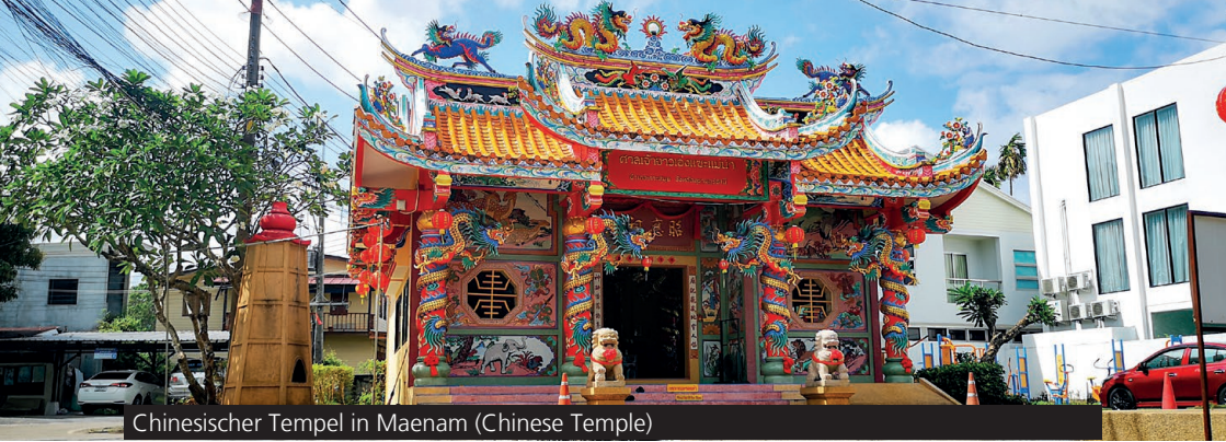
Chinesischer Tempel in Maenam (Chinese Temple)