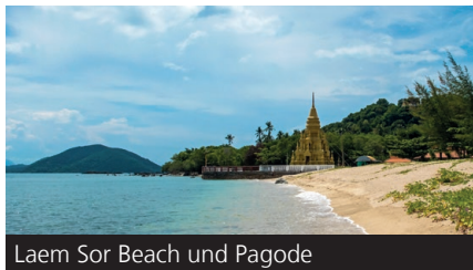
Laem Sor Beach und Pagode

Nun geht es wieder zurück nach links auf die Hauptstraße. Biege die nächste Straße rechts ab, um weiter nach Süden zu fahren. An der Kreuzung mit dem 7-Eleven biege nach rechts ab. Fahre die Straße etwa 5 Minuten entlang, bis auf der linken Seite ein kleines blaues Schild mit dem Namen "Laem Sor" erscheint. Biege links ab. Am Ende dieser Straße findest du die Laem Sor Pagode (6) vor. Siehe auch Seite 71.