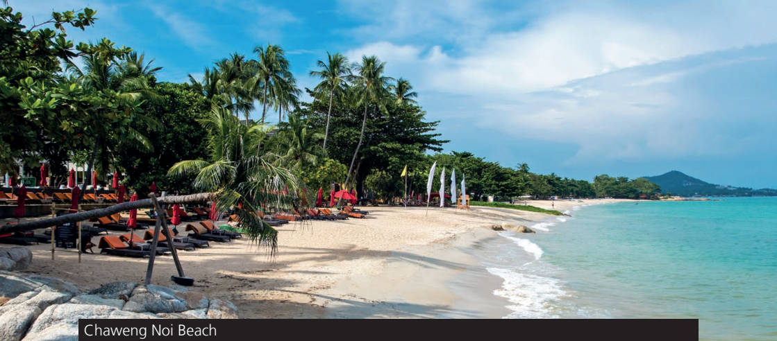
Chaweng Noi Beach

am Chaweng Lake an. Hier kannst du eine Runde Go Kart mit deinen Freunden fahren und jede Menge Spaß haben. Auch für Anfänger gibt es eine geeignete Rennstrecke (350 Meter) sowie für ein Rennen unter Freunden (800 Meter). Auch Karts mit zwei Sitzen sind vorhanden, falls Gäste dabei sind, die nicht selbst fahren können. EasyKart ist täglich von 10.00 bis 1.00 Uhr geöffnet. Preise starten ab ca. 500 Baht. www.easykart.net/koh-samui